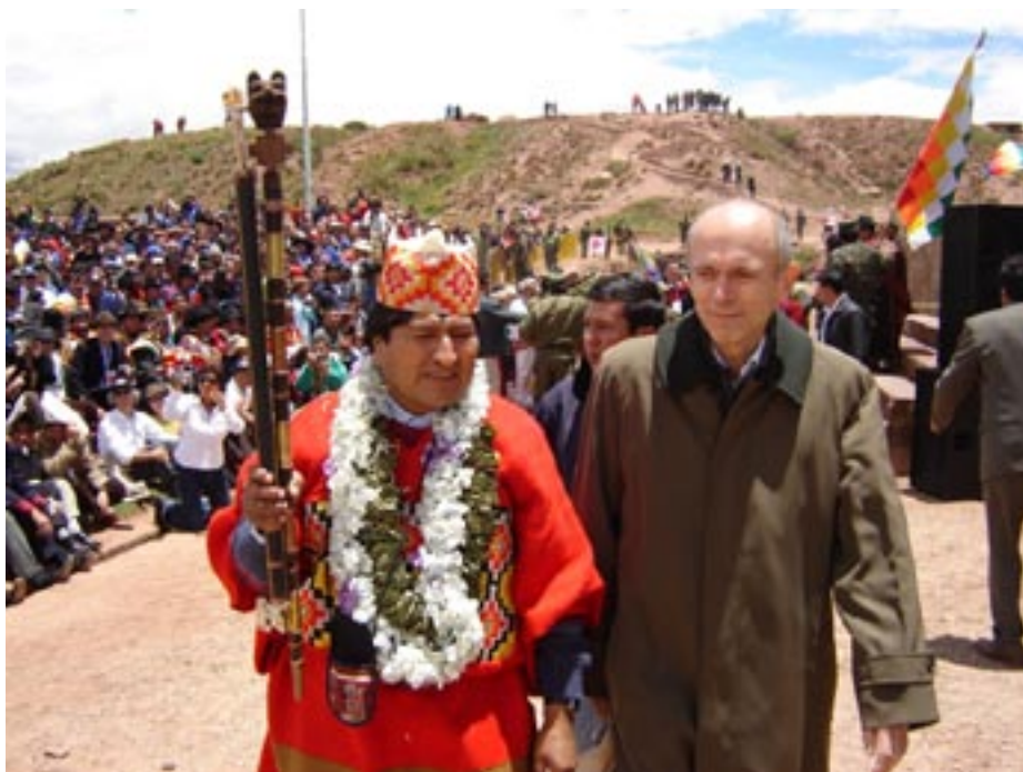
Dr. Janez Drnovšek je v starodavnem mestu Tiwanaku prisostvoval ustoličenju novega Bolivijskega predsednika Eva Moralesa Aime.

živel položaj v Boliviji in predsednika Eva Moralesa kot prvega indijanskega predsednika. Doživel sem veliko navdušenje ljudi, pričakovanje večinskega indijanskega prebivalstva, da je ta vlada drugačna, da je to prvič njihova vlada, da se gre prvič za njih, da ni vlada kapitala ali kolonistov, ki bo samo izkoriščala. Skratka, občutek je bil, da ljudje prvič mislijo: »Tokrat pa gre zares. Tokrat pa gre za nekaj drugega.« Mislim, da se bo ta trend nadaljeval. Vsekakor se v Južni Ameriki nadaljuje, čeprav v